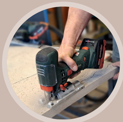
⇒ SCHNEIDEN MIT STICHSÄGE