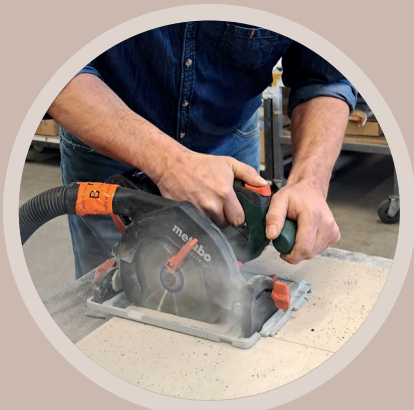
⇒ SCHNEIDEN MIT HANDKREISSÄGE

BESTELINFOS: KAMINBAUPLATTEN SUPER EASY Artikelnummer: 776754, 1 Palette = 18 Stück